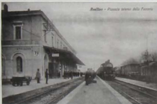
Avellino - Piazza lavoro della Ferrovia

Un carico che ha preferito il passaggio su gomma, confidando definitivamente quello su binario. Senza anticipare anche altri problemi legati agli spazi dello scalo: "La ditta che gestisce la movimentazione da quindici