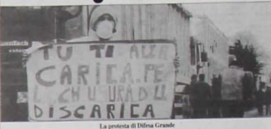
La protesta di Difesa Grande

AVELLINO - (Carla Impagliazzo) È ancora emergenza rifiuti in Irpinia. Il problema dello smaltimento torna di scottante attualità, contrapponendo ancora una volta cittadini e istituzioni. Uno scontro durissimo, con gli abitanti di Ariano Irpino che scendono in strada, attuando il blocco della circolazione, chiudendo le scuole e bloccando ogni forma di attività. Della vicenda si è occupata la stampa nazionale. Mentre andiamo in stampa la questione rifiuti non ha ancora trovato una definitiva soluzione, anche se sembra sempre più probabile l'ipotesi annunciata dal prefetto Catenacci con la discarica di Difesa Grande aperta fino al prossimo 19