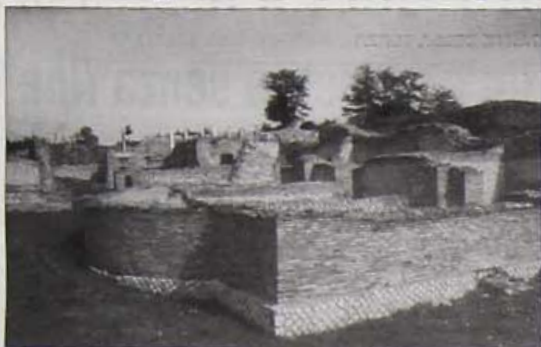
Le terme dell'antica Aeclanum

La proposta progettuale approvata, ricadente nel Por Campania - Asse 2, prevede, per l'intera area archeologica, il restauro, l'indagine archeologica, la messa in opera di percorsi e l'illuminazione dell'intera area. Inoltre è stata prevista per una valorizzazione complessiva del sito la realizzazione di servizi informatici, servizi di supporto al turismo, parcheggi, posto di guardia, sala polifunzionale e verde attrezzato. Si tratta, in sostanza, non solo di