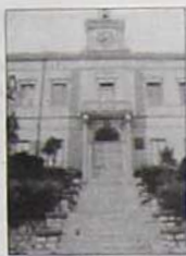
Il comune di Mercogliano