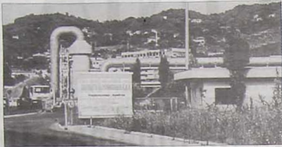
Il Cdr di Avellino

AVELLINO - L'emergenza rifiuti sta per giungere ad un punto di non ritorno e questa volta nessuna proroga o variante programmatica può evitare la crisi legata ad una data, quella del 12 settembre, quando, come disposto dalla magistratura di Napoli, scatterà il sequestro per tutti e sette gli impianti Cdr operanti sul territorio della Campania (Caivano, Giugliano, Tufino, Santa Maria Capua Vetere, Casalduni, Battipaglia e Pianodardi). Il tanto atteso adeguamento dei centri di riciclaggio sono stati avviati, ma la loro ultimazione sembra ancora da definire. Una situazione che è destinata a vivere grandissime difficoltà gestionali, facendo riemergere i problemi di vivibilità già patiti in molte zone della regione. Uno stallo, questo, generato da una scelta politica del governo regionale che pilatescamente si è chiamato troppo presto fuori di fronte alla mole di difficoltà emerse dalla gestione del problema-rifiuti. Soprattutto il discorso della realizzazione e installazione dei termovalorizzatori è stato accantonato frettolosamente e questo nonostante che queste