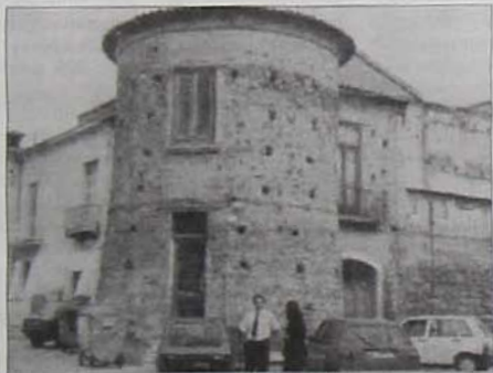
Una veduta del centro di Bonito