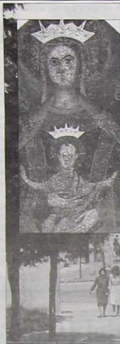
NOVE SECOLI DI FEDE DELLA COMUNITÀ DI CASTEL BARONIA

Anche l'episodio del 15 agosto del 1953 corre lungo il filo dei prodigi perché nella storia di Santa Maria delle Fratte il 15 di agosto non è un giorno qualsiasi: è il giorno della triplice incoronazione della Vergine, dovuto proprio al