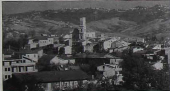
Una panoramica di Grottaminarda