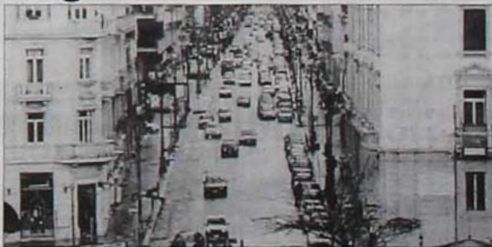
Avellino, Corso Vittorio Emanuele