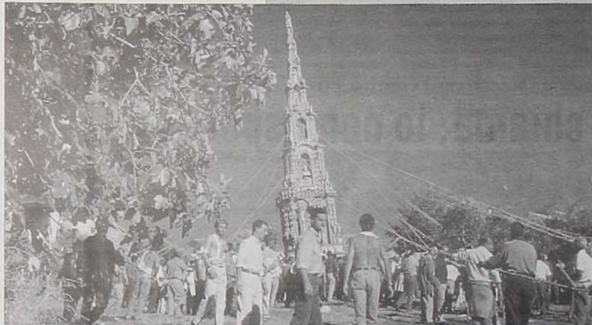
La «tirata» del carro di Mirabella

A Mirabella fervono anche i preparativi per la «grande tirata» dell'artistico obelisco di paglia che si terrà sabato 18 settembre. L'appuntamento è previsto per le ore 15 in contrada S. Angelo, quando la monumentale «macchina» lignea artisticamente rivestita con pannelli di steli di grano intrecciati, alta 25 metri, verrà trasportata da sei paia di buoi: fino al nono Borgo. La