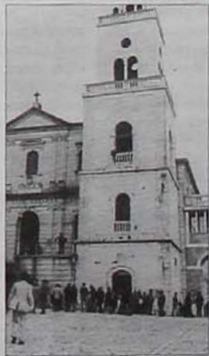
Il santuario di Materdomini

MATERDOMINI - Una giornata indimenticabile, che lascia preludere a centinaia di migliaia di presenze di fedeli nel corso dell'anno gerardiniano che sta per cominciare. Così il santuario di Materdomini, domenica scorsa, ha vissuto la prima tappa dell'anno gerardino, ciclo di manifestazioni in occasione del centenario della canonizzazione del santo «pazzarello di Dio» (l'undici dicembre prossimo) ed il 250° anniversario della morte (il 16 ottobre 2005). Per San Gerardo si muovono sempre di più le grandi folle, da tutto il Sud e sempre di più dall'estero. Ed ormai il fenomeno, oltre che di fede, è diventato anche di turismo religioso, con una serie di vantaggi non indifferenti per l'economia locale.