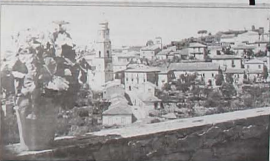
Una panoramica di Frigento

FRIGENTO - (Francesco Saverio D'Ambrosio) Parte dall'Istituto Comprensivo Statale di Frigento una nuova proposta culturale per la valorizzazione e scoperta delle zone interne dell'Irpinia. Il progetto, elaborato dal gruppo docenti F.O., si propone di offrire non solo un significativo percorso formativo, motivando gli alunni alla scoperta dei beni artistici, naturalistici, storici, culturali ricadenti nel bacino sia della valle dell'Ufita che del Calore, ma anche una guida turistica e un depliant che verranno realizzati al termine dell'esperienza didattica. Per questo sono state coinvolte nel progetto le diverse istituzioni scolastiche operanti sul territorio, in quanto gli alunni dovranno mettere a punto una proposta di visita (pachetto turistico) e prepara-