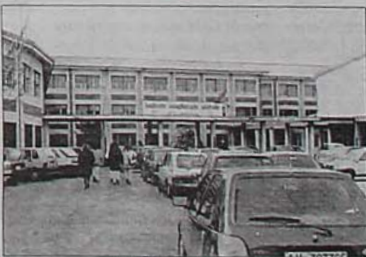
L'Istituto Magistrale «Imbriani»

AVELLINO - Sono diverse e molteplici le sensazioni che ci ha lasciato il disastro terremoto avvenuto in Molise, a poche centinaia di chilometri in linea d'aria. Innanzitutto abbiamo rivissuto fisicamente la paura del sisma, quella maledetta mattina, e il pomeriggio successivo e le notti pure. Quel "ballare" sulla sedia o in poltrona, quell'uscire precipitosamente da scuola o dall'ufficio, quel telefonare a parenti ed amici per chiedere "hai sentito il terremoto?", ci hanno restituito per intero la nostra piccolezza umana rispetto ad un evento che quando viene annulla le certezze, alimenta i timori, crea sconcerto, sensazione di impotenza. Ma non