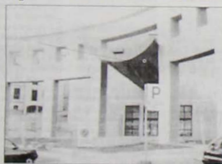
Il teatro comunale

Ma procediamo con ordine. Per la prosa sono in programma "Eduardo al Kursaal" (10 gennaio), con Silvio Orlando e Rocco Papaleo; "Riccardo III" (24 gennaio), con