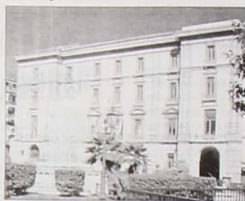
Palazzo Caracciolo, sede della Provincia

I Centri raccolgono le richieste e le aspettative, espresse dai giovani, attraverso una serie di colloqui di orientamento; promuovono percorsi integrati, tra istruzione e formazione professionale, per arricchire il curriculum di ognuno; organizzano tirocini formativi (stages) con la presenza di tutor; danno l'opportunità di acquisire crediti formativi utili all'instaurazione di un rapporto lavorativo.