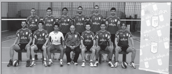
La Sidagas Atripalda

Alla fine del quarto, decisivo set è scoppiata la gioia incontenibile di tutto il pubblico di fede biancoblù presente nell'impianto irpino. Il risultato raggiunto ha dello straordinario e, forse, nemmeno il più ottimista dei tifosi se quasi impossibile. Il mio ringraziamento va a loro, ma non solo. Innanzitutto ho potuto vivere questa esperienza importante grazie alla vecchia società che mi ha voluto ad Avellino dove ho trova-