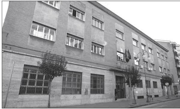
La sede dell'Alto Calore

AVELLINO - Con il raggiungimento del quorum dei votanti ed una percentuale di consensi a dir poco "bulgara", i referendum sull'acqua hanno nuovamente cambiato le carte in tavola in vista degli affidamenti della gestione del servizio idrico integrato. La politicizzazione della consultazione referendaria, che di fatto si è risolta in una nuova ondata di protesta contro Berlusconi ed il suo governo, forse ha semplificato eccessivamente la portata ed il significato dei quesiti e - soprattutto - ha in gran parte ignorato le conseguenze connesse all'abrogazione delle norme sottoposte al vaglio degli elettori. E ancora prematura una valutazione seria e ponderata degli effetti dei referendum. E se è vero che cade l'obbligo di affidare il servizio ad un gestore che sia quantomeno parzialmente privato, è altrettanto vero che non si introduce il divieto di affidamento ai privati. Come è già accaduto