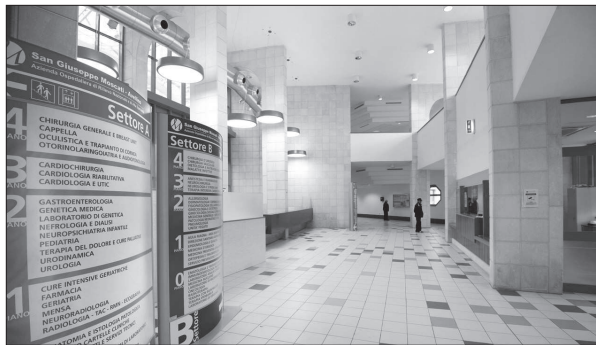
La Città ospedaliera

no frutto di un pur acceso scontro politico. Ma era scontro che mirava a capire e ad ottenere condizioni di vita migliore in un pezzo di meridione non particolarmente fortunato (ammesso che il resto del Sud lo fosse).