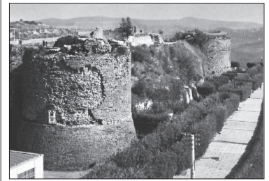
Ariano Irpino, il castello normanno

ARIANO IRPINO - Il Comune di Ariano Irpino rinnova l'appuntamento, nei giorni 5, 6 e 7 agosto, per la XV edizione, di "Vicoli ed arte", che si terrà, come di consueto, nell'incantevole scenario del centro storico della Guardia, dove l'antico cuore della città tornerà a rifiorire aprendo, nei suoi vicoli, le cantine che si trasformeranno in botteghe artigiane e locande gastronomiche. L'intento dell'amministrazione comunale, ed in particolare degli assessorati alla Cultura, alle Attività produttive e all'Agricoltura, è quello di promuovere la conoscenza, la conservazione e la valorizzazione del centro storico, mediante attività culturali, didattiche, ricreative, turistiche, che possano far sentire il visitatore proiettato nel passato, in un mondo ricco di valori e di lavoro creativo.