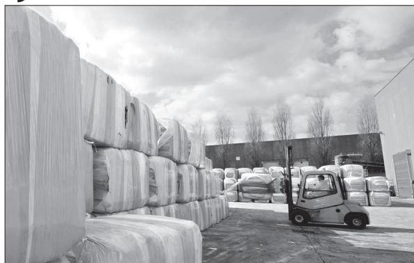
Il Cdr di Pianodardine

Il fragile equilibrio trovato con l'accordo sottoscritto a Palazzo Chigi lo scorso 4 gennaio rischia di essere compromesso proprio alla vigilia della calda stagione estiva, con tutti i rischi per la salute dei cittadini che ne conseguono. Il trasferimento dei rifiuti bloccato dal Tar è il perno sul quale poggiava tutto il piano per uscire dall'emergenza, in attesa della costruzione degli impianti necessari. Il problema è che, allo stato attuale, ed in attesa della realizzazione dei tre grossi impianti di compo-