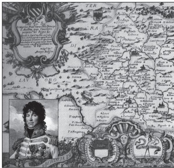
Una stampa del Principato Ultra di Antonio Bulifon del 1697. Nel riquadro, Gioacchino Murat

Essa si trova custodita presso la Biblioteca della società di storia patria di Napoli e seppur priva di datazione è collocabile intorno alla seconda metà del 1810, grazie ad una puntuale e dettagliata ricostruzione e comparazione dei resoconti. Oggi il testo si presenta in un discreto stato di conservazione, anche se difetta di un'adeguata rilegatura che ne compromette la naturale consequenzialità: in esso figurano gli interventi di De Leo e altri più piccoli contributi dei suoi collaboratori che è possibile riconoscere evidentemente per la diversa grafia e l'uso della struttura sintattica. Si può in ogni caso evidenziare una suddivisione in due parti, di cui la prima è sicuramente più frammentata e disorganica, la seconda