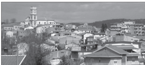
Una veduta di Grottaminarda

Per discutere di queste problematiche, si è tenuto a Grottaminarda, la settimana scorsa, un interessante incontro, presso il municipio, tra gli amministratori dei Comuni di Melito, Bonito, Sturmo, Frigento, Flume-