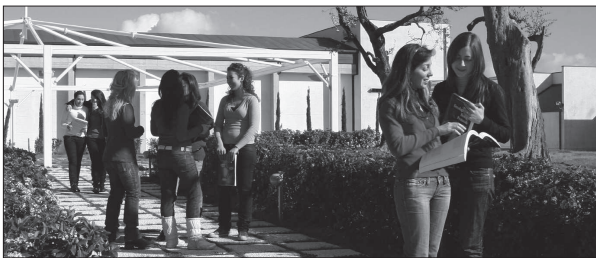
Studenti-corsi alla Biogem di Ariano