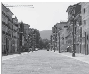
Avellino, Corso Vittorio Emanuele

È di pochi giorni fa il grido d'allarme lanciato dalla locale Confcommercio sulla grave fase recessiva attraversata dal settore distributivo nel capoluogo. Sono decine gli esercizi che hanno chiuso i battenti. Crisi dei consumi e fitti troppo alti le cause principali della falciatura che ha colpito le attività mercantili della nostra città. E non solo queste, giacché, a scorrere le statistiche diffuse dall'Osservatorio nazionale del commercio - organismo del ministero dello Sviluppo economico - la flessione ha coinvolto l'apparato distributivo dell'intera provincia di Avellino. La quale ha fatto segnare, nel 2010 rispetto all'anno precedente, un netto calo nella consistenza degli esercizi commerciali, in controtendenza con il resto del Paese e della stessa regione Campania dove la rete commerciale è riuscita a mantenere i livelli precedenti, addirittura incrementandoli, sia pure di poco.