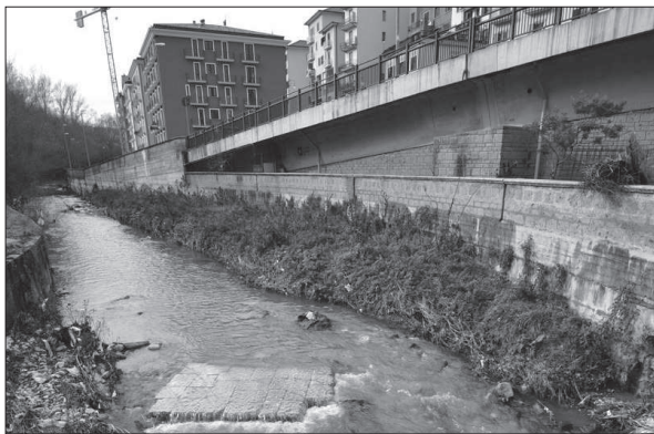
Un tratto del torrente Fenestrelle

L'intervento sui tratti avellinesi dei due torrenti è atteso per due motivi. Il primo, ovvio, per un'esigenza di sicurezza; il secondo perché i torrenti attraversano aree destinate dal Pua (Piano urbanistico attuativo) a verde pubblico, a parchi. Anche a questo fine, naturalmente, la sicurezza è il primo passo da compiere. Il Fenestrelle entra in Avellino dopo aver ricevuto acque non proprio limpide sia da Monteforte che dal denso insediamento di Torrette di Mercogliano nella zona sottostante la chiesa dell'Assunta. Proprio al di sotto di questa chiesa c'è la confluenza delle acque nere della zona ad ovest di Avellino che attraverso una condotta quasi parallela al torrente (soluzione degli anni Settanta non proprio ottimale) finisce poi nel collettore che porta al depuratore di Pianodardine. Sul suo percorso il corso d'acqua - alla