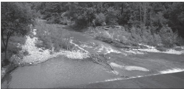
Una veduta del Calore

VENTICANO - Il Comitato di tutela del fiume Calore - sorto in seguito agli avvenimenti di inquinamento batterico della scorsa estate, che portarono al divieto di pesca e al prelievo dell'acqua per fini irrigui o domestici da parte di molti sindaci dei territori attraversati dal fiume - seguita ad essere vigile sulla situazione ambientale delle acque su cui continua ad incombere una più che seria minaccia. Proseguono, infatti, le riunioni del Comitato per fare il punto della situazione e monitorare con frequenza eventuali scarichi abusivi e i depuratori comunali, spesso mal funzionanti o non in regola con le norme di tutela ambientale. Del resto, dopo l'emergenza che si è verificata l'estate scorsa, sono molti i cittadini che hanno sottoscritto una petizione