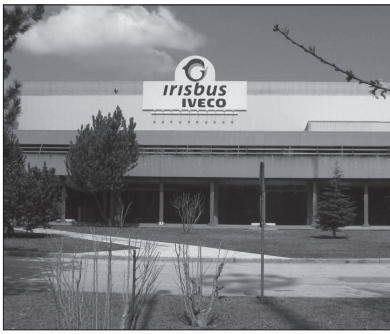
Lo stabilimento dell'Irisbus di Flumeri