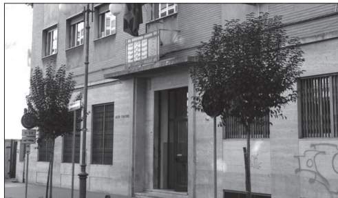
La sede dell'Alto Calore

Nel frattempo, in una disperata corsa contro il tempo e dopo anni di inspiegabile immobilismo, la dirigenza dell'Alto Calore Servizi finalmente avviò un percorso diretto alla realizzazione delle condizioni necessarie per ottenere l'affidamento del servizio idrico integrato. Furono compiuti passi importanti verso l'acquisizione della consapevolezza che