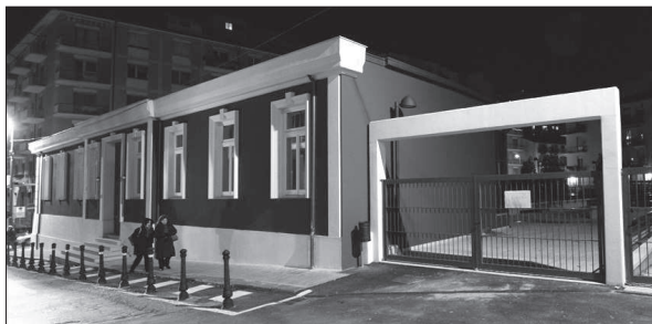
Asilo Patria e Lavoro

AVELLINO - Opere pubbliche, qualcosa si muove. È infatti in arrivo, nell'ambito del programma Europa Piu (Programmi integrati urbani) un finanziamento di circa 30 milioni di euro che consentirà di ultimare diverse strutture rimaste in sospeso. La firma ufficiale dell'accordo, con l'attivazione della cosiddetta cabina di regia, ci sarà il prossimo 22 novembre, nella sala consiliare del Comune di Avellino, presente l'assessore regionale all'Urbanistica Marcello Tagliacarne. Seguirà, nelle prossime settimane, un nuovo incontro con il presidente della giunta della Campania, Stefano Caldoro. Qualcosa si muove anche per quanto riguarda i bandi per la gestione. Le prime due strutture che verranno messe in funzione, tra le sette riqualificate recentemente dal Comune di Avellino, sono l'asilo Patria