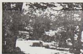
I MONTI PICENTINI IL TERMINO IL CERVALTO

TRA LA PIANURA CAMPANA E IL TAVOLIERE PUGLIESE "RITROVI LA NATURA"