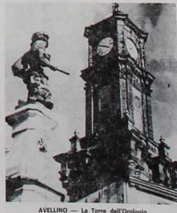
AVELLINO — La Torre dell'Orologio

Occorre quindi appurare dei correttivi e, soprattutto, introdurre elementi di chiarezza laddove, in particolare per quanto attiene alla normativa e alle zonizzazioni si ha la preoccupazione che talune scelte e le difficoltà interpretative potrebbero, nella logica di attuazione del piano, risolversi in provvedimenti ingiusti o illegittimi, che finirebbero con lo snaturare la volontà consiliare.