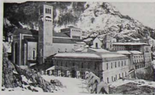
MONTEVERGINE — Una veduta del complesso abbaziale

MERCUGLIANO - Tra le altre, due storiche iniziative sono state programmate, a Montevergine, a conclusione dell'Anno Giubilare del IX Centenario della nascita di S. Guglielmo Abate.