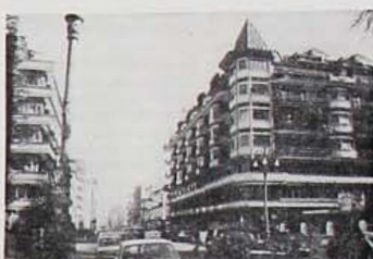
AVELLINO - Corso Vittorio Emanuele