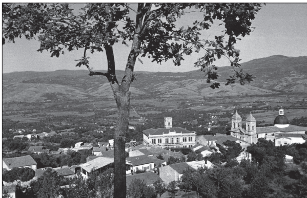
Una veduta di Sturno

STURNO - Ha duecento anni di vita il Comune di Sturno. L'8 aprile del 1809 è la data ufficiale della nascita del centro irpino, quando gli antichi casali del Comune di Frigento ebbero, nel periodo murattiano, l'autonomia amministrativa, approvata dal ministro dell'interno dell'epoca Giuseppe Capocelatro. Si realizzava così un legittimo desiderio che era sorto due secoli prima, perché la sede del Comune si trovava a Frigento e per gli abitanti del casale era molto faticoso recarsi nelle sedi comunali dovendo salire per una stradina impervia e ripida. Anche per la spinta di alcune famiglie nobili del posto, come i Grella e i Testa, avvenne una sorta di rivolta per favorire l'autonomia del casale, il cui nome fu mutato dallo sturno, volatile chiamato in dialetto "sturno". Gli abitanti del luogo, come si racconta, erano soliti ascoltare il canto di questo uccello perché l'animaletto si trovava chiuso in una