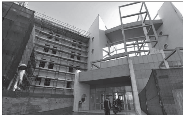
L'ingresso della città ospedaliera

AVELLINO - La sanità pubblica in Campania è al collasso. Il recente commissariamento di tutte le Asl campane ha definitivamente sancito, ove ve ne fosse stato bisogno, la crisi pressoché irreversibile del servizio sanitario regionale. Il debito pubblico accumulato ha assunto proporzioni impressionanti e sembra avvicinarsi sempre più un altro commissariamento, ancora più clamoroso, quello dell'intero servizio sanitario regionale, che è stato più volte minacciato dal governo. Non bastano, però, i commissariamenti né altri provvedimenti straordinari, per risolvere di punto in bianco le sorti di un settore strategico che rappresenta il crocevia di tutti i problemi della Campania: dalla sanità ai rifiuti; dall'inquinamento alle sofisticazioni alimentari, alla sicurezza, e ad altro ancora. La crisi della sanità richiede interventi strutturali e permanenti, diretti a garantire, da una parte, accettabili standards di servizi, e, dall'altra, la salvaguardia degli equilibri economico-finanziari dei bilanci delle aziende ed enti sanitari. Non sono utili allo scopo i tagli indiscriminati alla spesa, che assicurano il recupero di risorse e fondi finanziari, ma abbassano il livello dei servizi. Non serve, insomma, tagliare, ma, piuttosto, è necessario razionalizzare le risorse. Da questo punto di vista le misure adottate rischiano di rivelarsi da subito un fallimento. Il commissariamento, infatti, è stato accompagnato dalla riduzione del numero delle Asl mediante l'accorpamento di