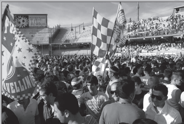
Tifosi del Partenio

AVELLINO - C'è il Piacenza sulla strada verso la salvezza dell'Avellino. I tifosi sperano. Oggi pomeriggio, al Partenio, con inizio alle ore 16, la squadra di Stefano Pioli proverà a mettere il bastone fra le ruote alla truppa di mister Campilongo. Ai biancorossi mancherà sicuramente l'esperto attaccante Mattia Grafedi, squalificato dal giudice sportivo dopo l'espulsione nel match col Brescia. Contro i "lupi" Pioli potrebbe proporre il tradizionale 4-3-3 con Guzman e Ferraro ai lati di Moscardelli oppure un prudente 4-4-2 con Naingolan in aggiunta al settore nevralgico e uno tra Ferraro e Guzman in panchina. Oltre al buon attacco, il Piacenza può contare sulla regia illu-