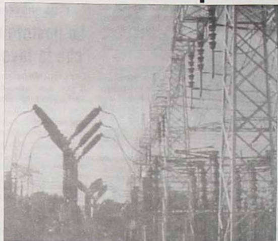
Tralicci di una centrale

FLUMERI - La protesta a Flumeri non si ferma. Il progetto di realizzazione di una centrale termoelettrica da parte dell'Edison tiene tutti, agricoltori, amministratori della zona, partiti politici e associazioni ambientaliste, sul chi va là. Non è infatti scongiurata del tutto che la società Edison, del gruppo Fiat, realizzi la costruzione della centrale elettrica da 450 megawatt nell'area adiacente allo stabilimento Iribus. Già in passato c'erano state prese di posizioni molto forti sia del Comune di Flumeri sia dell'Amministrazione provinciale che in più occasioni e nelle diverse sedi istituzionali avevano espresso un chiaro no alla realizzazione dell'impianto adducendo un danno ambientale notevole non solo per lo sviluppo agricolo locale, ma anche per la stessa salute degli abitanti a causa dell'emissione di vapori e polveri fini nell'atmosfera. Anche la Commissione Sanità regionale ha