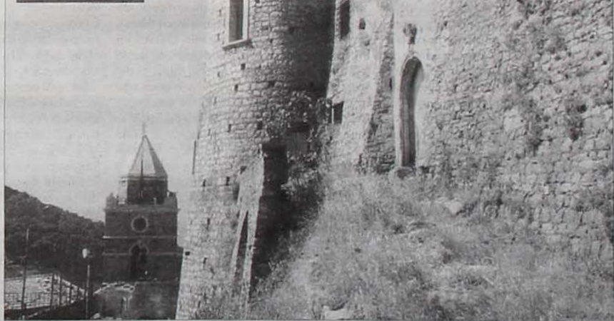
Il castello medievale di Monteverde. Nel riquadro, Francesco De Sanctis