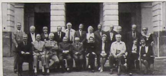
Una foto di gruppo della III C... 50 anni dopo

L'amarcord di un gruppo di compagni di scuola - anzi, di classe: la terza C del "Liceo Colletta" di Avellino dell'anno scolastico 1953-54 - che diventa un importante frammento di microstoria della cultura e del costume di una città e di un'epoca, impreziosito da un'appendice fotografica (foto di gruppo a scuola, nelle gite, in gare sportive) che emoziona ed avvincente per la sua duplice caratteristica di restituirci immagini di un passato recente ed il senso diacronico dell'evoluzione e del cambiamento. Sono molteplici, insomma, le ragioni che spingono a consigliare la lettura di un elegante volumetto che, pur concepito senza grandi pretese storico-letterarie, risulta in realtà più utile ed interessante di tanti saggi ponderosi e senz'anima, e persino - last but not least - assai più cu-