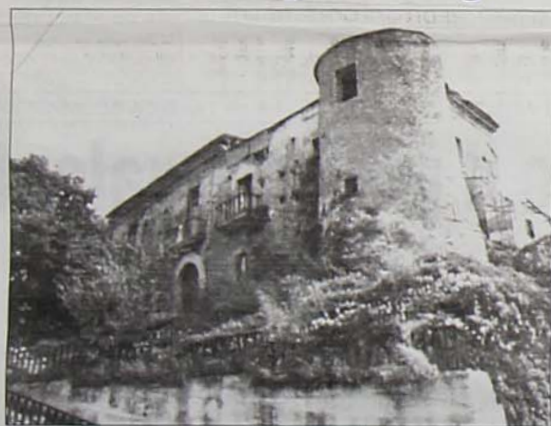
Il castello di San Barbato a Manocalzati