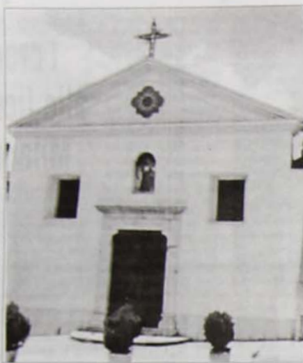
Chiesa di San Bernardino