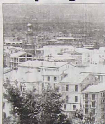
Una veduta di Avellino

L'amministrazione comunale, in questo caso, ha voluto riqualificare un'area da tempo abbandonata al proprio destino. L'ex campo Amalfi, dove negli anni '80 campeggiavano i prefabbricati post sismici, da qualche anno era diventata una vera e propria discarica a cielo aperto nonché ri-