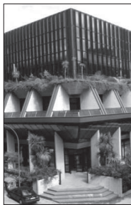
L'Isa di Avellino

"L'autenticità e la rintracciabilità - è stato rilevato nel corso dei lavori - rappresentano due aspetti chiave nella produzione degli alimenti tradizionali e l'Unione Europea e gli Stati membri hanno adottato sistemi di marchi e regolamenti per tutelare i prodotti tipici. I recenti scandali legati a frodi relative all'origine dichiarata, all'autenticità, alla sicurezza e all'etichettatura di alcuni formaggi con forte legame ai territori, hanno minato la fiducia dei consumatori nei marchi a tutela della qualità e causato danni significativi ai produttori nonché all'immagine del Made in Italy".