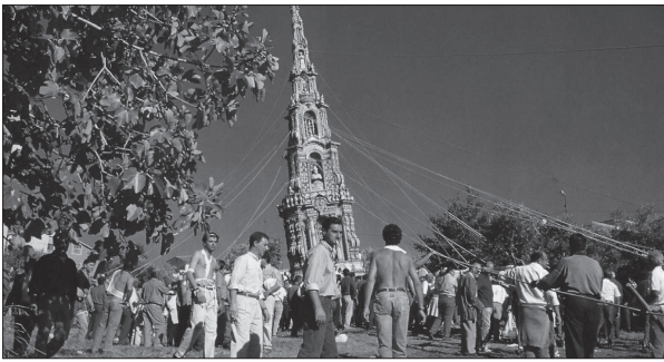
Mirabella, la tirata dell'obelisco di paglia

In programma per sabato 19 settembre prossimo, alle ore 14,00, vi è il trasporto dell'obelisco, che viene effettuato, come ogni anno, in onore della Madonna Addolorata e coincide grossomodo con l'equinozio d'autunno, al termine cioè dei lavori della mietitura. Il periodo non è a caso perché le origini della festa vanno ricercate nei riti pagani di ringraziamento per le messi e modificati dalla Chiesa cattolica in senso devozionale per festeggiare e ringraziare un santo patrono. Nel caso di Mirabella la tradizione è legata al culto dell'Addolorata a cui i contadini eclanesi, già dal 1600, offrivano il grano mietuto, la cui quantità dipendeva dal raccolto ottenuto.