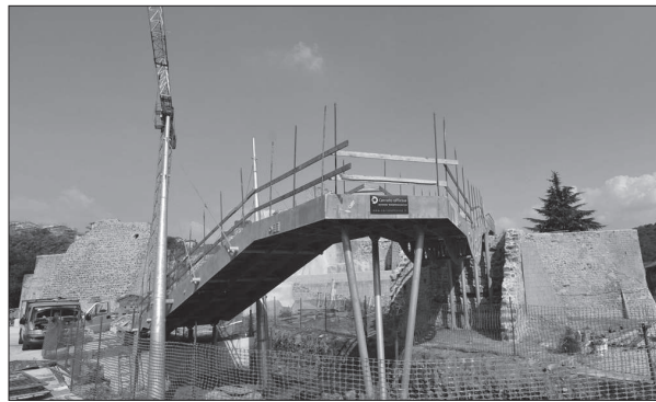
La scala di accesso al castello al centro delle polemiche