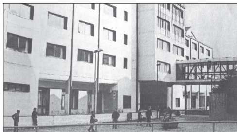
La sede del Comune di Avellino

Prima di affrontare le questioni che nascono dall'incredibile stallo determinatosi al Comune di Avellino occorre un atto doveroso: fare l'elogio del consigliere comunale; del ruolo del consigliere comunale. Perché a quanto pare da qualche anno a questa parte è difficile limitarsi a fare il consigliere dopo aver fatto campagna per farsi eleggere. È difficile perché appena eletto il consigliere pensa subito di avere diritto ad essere nominato assessore. E qui cominciano i guai del sindaco che per accontentare tutti dovrebbe avere quaranta assessori. L'altro guaio è costituito dal fatto che lo spirito della legge di riforma degli enti locali - che prevede la nomina di cittadini in giunta (e non obbligatoriamente di