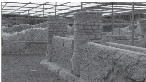
Gli scavi di Abellinum

Il progetto è nato con l'intento di valorizzare i quattro siti archeologici più importanti della provincia attraverso visite guidate e percorsi tematici con animazioni. Il tutto supportato da una rassegna di spettacoli ed esibizioni musicali di tanghi, milonghe e brani della musica popolare argentina. Questa volta sarà la domus romana di Abellinum ad ospitare questo interessante viaggio alla scoperta delle abitudini, di costumi e degli usi legati alla vita domestica di una antica città provinciale. Sono state infatti