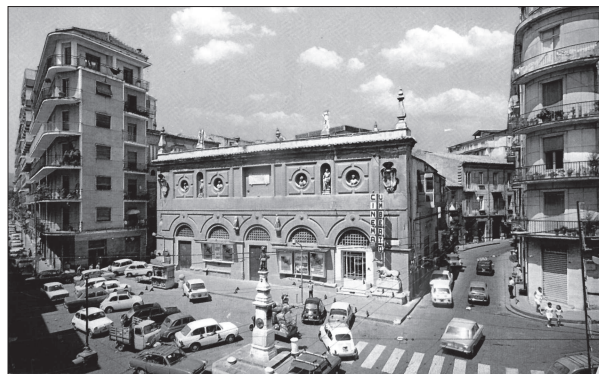
La dogana di Avellino in una foto degli anni '70

«Luna d'autunno» sarà caratterizzata dalla degustazione e vendita di prodotti tipici