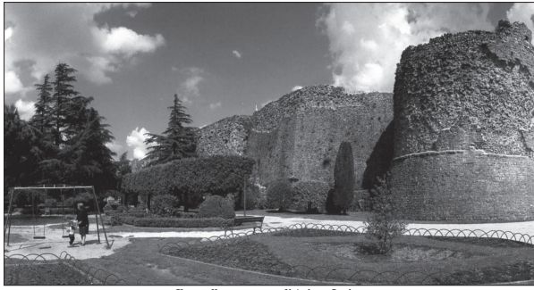
Il castello normanno di Ariano Irpino

ARIANO IRPINO - È un omaggio alla storia normanna, dalle origini del Regno fino alla fine, con uno spazio specifico sulla storia di Ariano nel periodo normanno-svevo, il percorso museale allestito nelle sale del castello della città del Tricolle. Un omaggio che nasce dalla volontà di ricostruire il ruolo determinante che Ariano ha avuto nella storia del Mezzogiorno normanno in quanto luogo in cui sono state promulgate le "Assise di Ariano", prime leggi unitarie del Regno di Sicilia, ed è stata coniata una moneta, il Ducale. Punto di riferimento dell'esperienza normanna in Italia meridionale è il neonato "Museo della Civiltà Normanna", ubicato nel nuovo fabbricato inserito tra le mura del castello, da qualche settimana aperto al pubblico. Un museo voluto soprattutto dal Cesn (Centro Europeo di studi normanni) che l'amministrazione comunale ha voluto realizzare con grande forza per dare un nuovo input allo sviluppo della città e soprattutto creare nuove attrattive anche a livello turistico. In quest'ottica va collocata anche l'apertura al pubblico dello stesso castello, dopo i lavori di riqualificazione che hanno interessato il