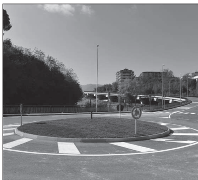
La rotonda sulla bretella