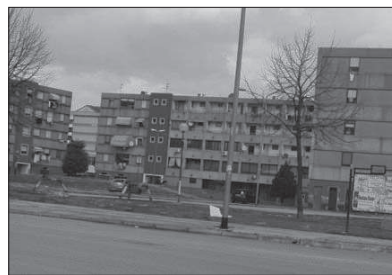
Una veduta di San Tommaso

«Non è un progetto che appartiene al libro dei sogni - spiega Piano - ma è un'iniziativa che rientra in una pianificazione finalizzata a rendere il capoluogo irpino più vivibile e ad offrire ai cittadini quartieri più sani e sicuri attraverso percorsi