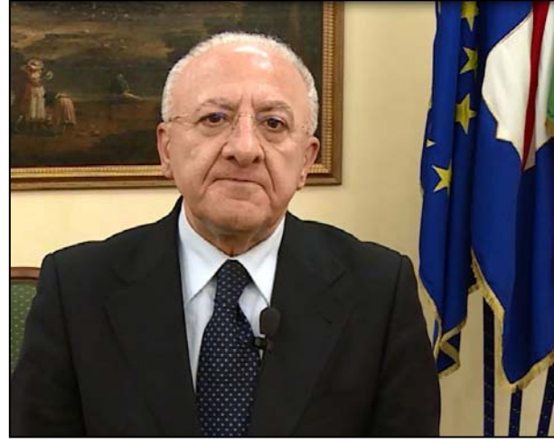
Vincenzo De Luca

avrebbe determinato anche un ritardo nell'accredito dell'acconto di 8 milioni di euro del fondo di rotazione, spettante al capoluogo irpino. In realtà, la vicenda non è del tutto lineare. Il Consiglio comunale di Avellino avrebbe approvato in ritardo, rispetto al termine di 90 giorni previsto dalla legge, il piano di riequilibrio precedentemente predisposto da Priolo. Una situazione che farebbe sfumare l'opzione del risanamento, imponendo la dichiarazione di dissesto. Ma la giurisprudenza in merito è tutt'altro che pacifica. L'amministrazione cittadina, quindi, sta cercando di sbrogliare la matassa, per evitare uno scivolone non da poco per la gestione economica dell'ente, che porterebbe inoltre allo scioglimento del Consiglio comunale. Intanto, nel centrosinistra si discute, senza un vero luogo di confronto, delle candidature per le Regionali. La postazione apicale dovrebbe essere appannaggio del governatore uscente, Vincenzo De Luca, anche se