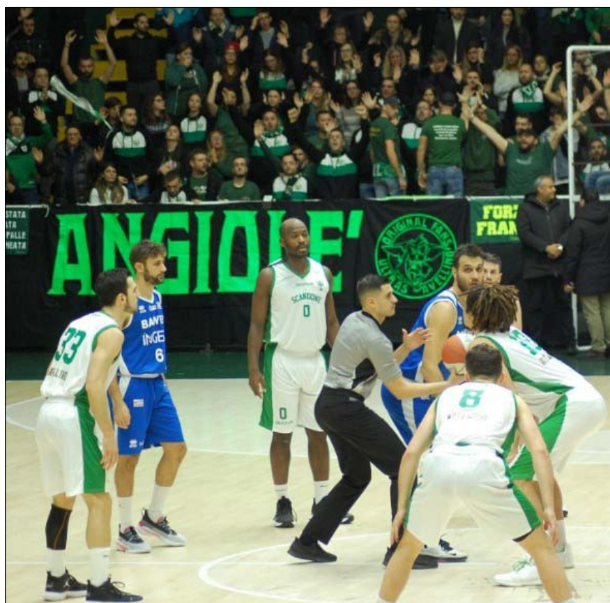
Una fase di gioco

Finalmente la Scandone ha giocato di squadra, con ben sei uomini in doppia cifra, e con una panchina che ha dato il suo fondamentale apporto alla causa comune. Con questo successo la formazione avellinese porta a sei punti il distacco dalle due ultime in classifica, Cassino e Sauri con 4 punti, raggiunge a quota 10 il Formia, e "vede" più da vicino Corato (12 punti) e la stessa Stella Azzurra, ferma a quota 14, ma battuta per due volte negli scontri diretti con