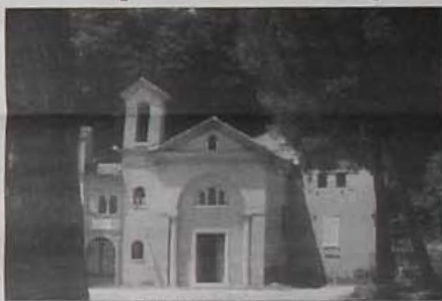
Prata, la Chiesa dell'Annunziata

Secondo i proprietari dell'impianto e l'Amministrazione comunale (che ne ha autorizzato la realizzazione), l'ecosistema della zona non subirà alcun danno dal momento che saranno utilizzati sistemi di depurazione e filtraggio dei fumi che eviteranno qualsiasi forma di inquinamento. Di diverso parere,