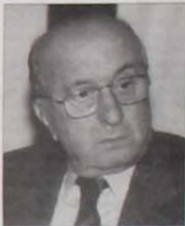
Ciriaco De Mita

AVELLINO - Un altro giornalista. Dopo Mastella e dopo Di Nunno, Ciriaco De Mita pesca nel mondo del giornalismo, stavolta televisivo, per lanciare nuovi candidati Mastella (molti anni fa) e Di Nunno (più recentemente) furono due intuizioni per portare in politica e nell'amministrazione, rispettivamente, un nuovo deputato e, in piena epoca Tangentopoli, un sindaco per la città di Avellino. Resta il dato storico, non importa che poi sia Mastella che Di Nunno non siano più dominanti: il primo, dopo la diaspora della Dc, ha addirittura fondato un partito tutto suo, l'Udexit, di cui è segretario nazionale. Il secondo, concluda con le dimissioni - otto mesi prima della fine del mandato - l'esperienza da sindaco di Avellino, è tornato a svolgere,