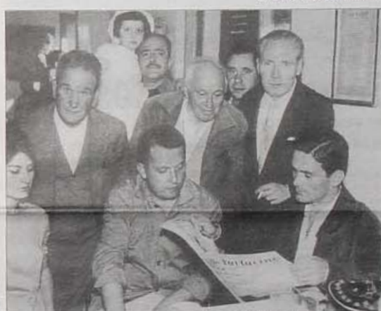
Pasolini con gli amici di Bagnoli mentre legge "Il Tartarino"